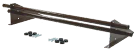
Снегозадержатель Optima 1 м