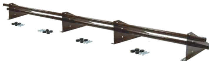
Снегозадержатель Optima Плюс 3 м