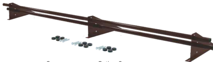
Снегозадержатель Optima 3 м